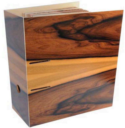
Das Rohol-Furnierkompendium ist ein aufwendig gestaltetes, edles Nachschalgerwerk, in dem jede Holzart „begriffen“ werden kann (Vertrieb über www.fachbuchquelle.de ).

terreichischen Firma Rohol. Zwischen Baustahlgittern und Graffitis wurden die neuesten Furnierkreationen präsentiert: Hirnholzflächen mit Hochglanzlackierung, dreidimensionale Furniere in außergewöhnlicher Optik und die neue PUR-Linie. Auch die „Free-Ply“-Plattenprodukte zogen die internationalen Besucher in ihren Bann. „Die von Rohol erstmals 2010 vorgestellten 3D-Furniere ‚Rough‘ und ‚Wave‘ sind mittlerweile